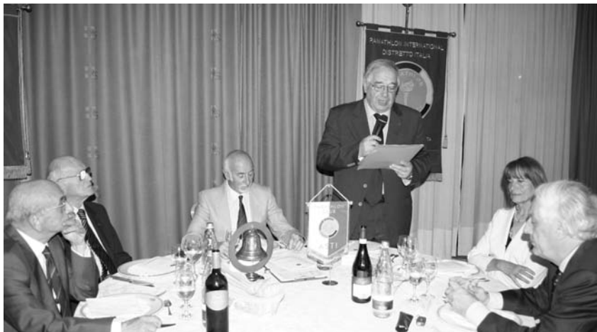
In basso il saluto del Governatore ai panathleti intervenuti alla serata del 7 Maggio ospitata al Ristorante Salera.

ravano i tempi per la nascita del Panathlon Club Asti, il 77° nel mondo. Era il 26 Aprile 1962.