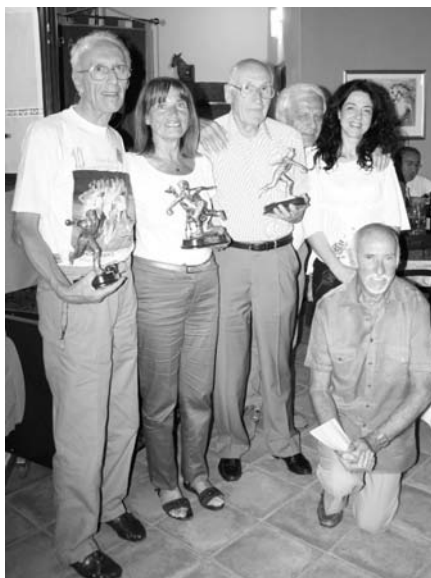
I vincitori della gara panathletica a bocce del Luglio 2008

Ancora pochi giorni e tornerà la gara sociale panathletica abbinata per tradizione alla Conviviale di Luglio.