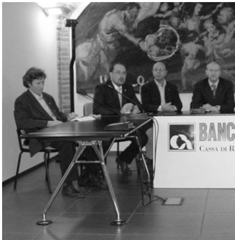
Le autorità intervenute lo scorso 13 Marzo alla Sala Convegni della Banca CR A

La risposta delle Scuole è andata oltre le più rosee previsioni con ben 486 lavori realizzati dagli studenti sui temi proposti. In attesa di conoscere il nome degli autori dei 5 migliori elaborati (nel corso di una conferenza stampa di fine Ottobre), è comunque già ufficiale la classifica degli istituti che hanno presen-