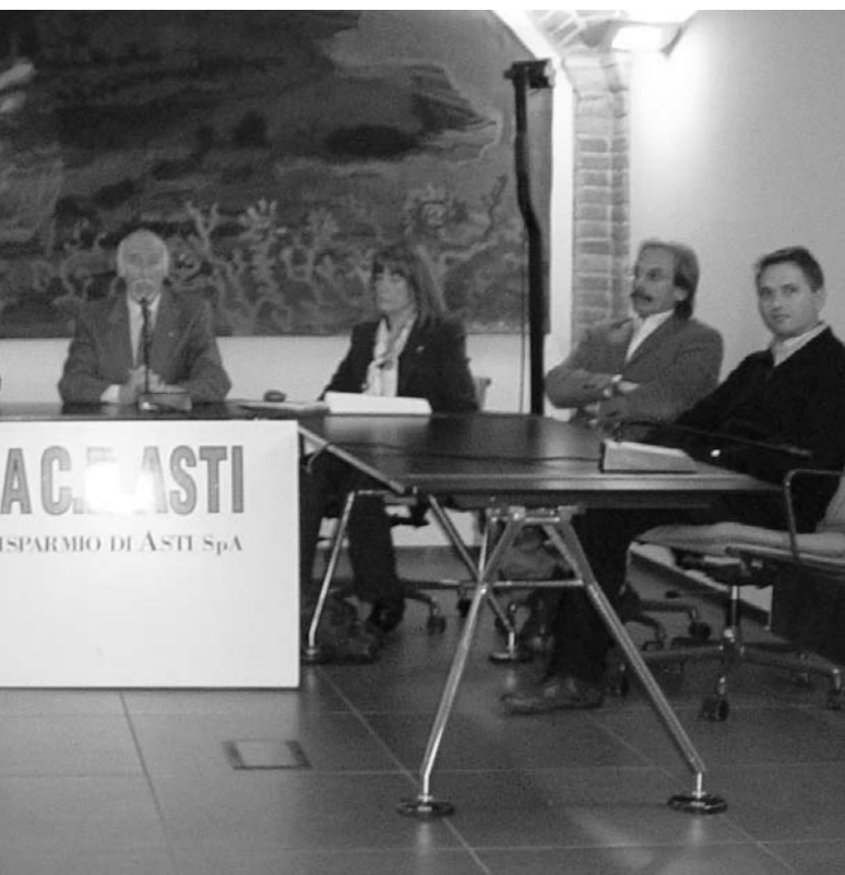
...asti in occasione della Presentazione ufficiale del Concorso grafico.

le cui opere (ben 486 tra Medie e Superiori) saranno esposte in quei giorni nella ex Chiesa di S. Giuseppe Panathletica: premi e “conviviale olimpica” occasione tecnici ed atleti che hanno vestito la maglia azzurra anche nelle successive “Paralimpiadi”