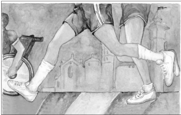
Il nuovo logo che comparirà sulle magliette 2010

Come si ricorderà con le opere pervenute era stata realizzata una mostra ospitata al "Centro Giraudi", ex