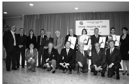
APRILE "Premi Panathlon"