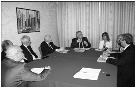
MAGGIO "Visita del Governatore"