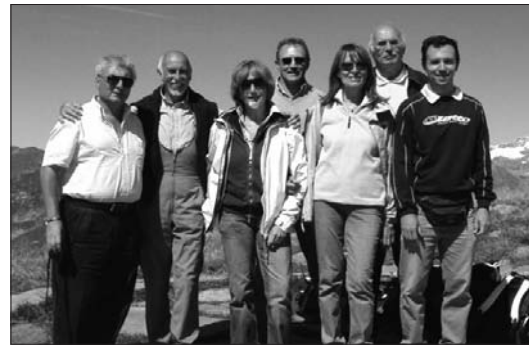
SETTEMBRE "Interclub a Biella"