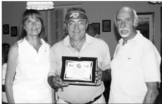
LUGLIO "Gara sociale"