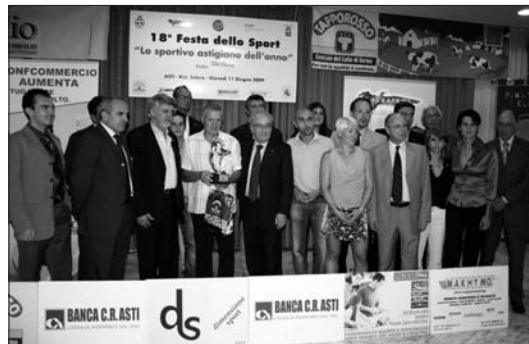
GIUGNO "Festa dello Sport"