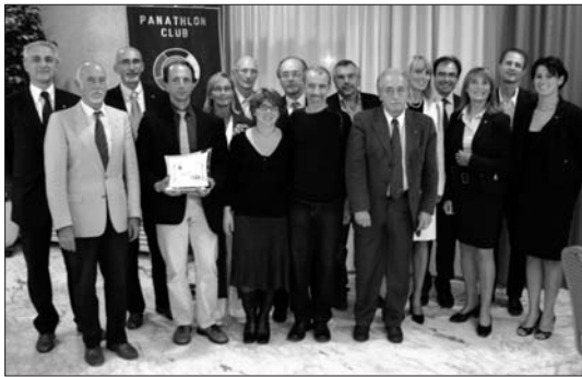
OTTOBRE "Master astigiani atletica"