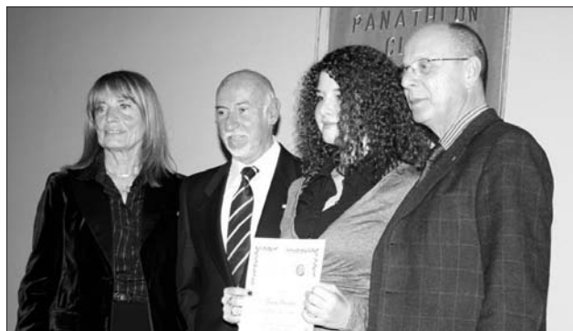
Le numerose autorità intervenute in Sala Pastrone Giovedì 12 Novembre. A destra il parroco della Chiesa