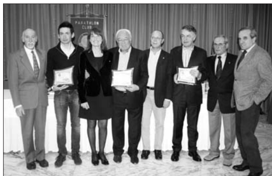
MARZO "Centenario Giro d'Italia"