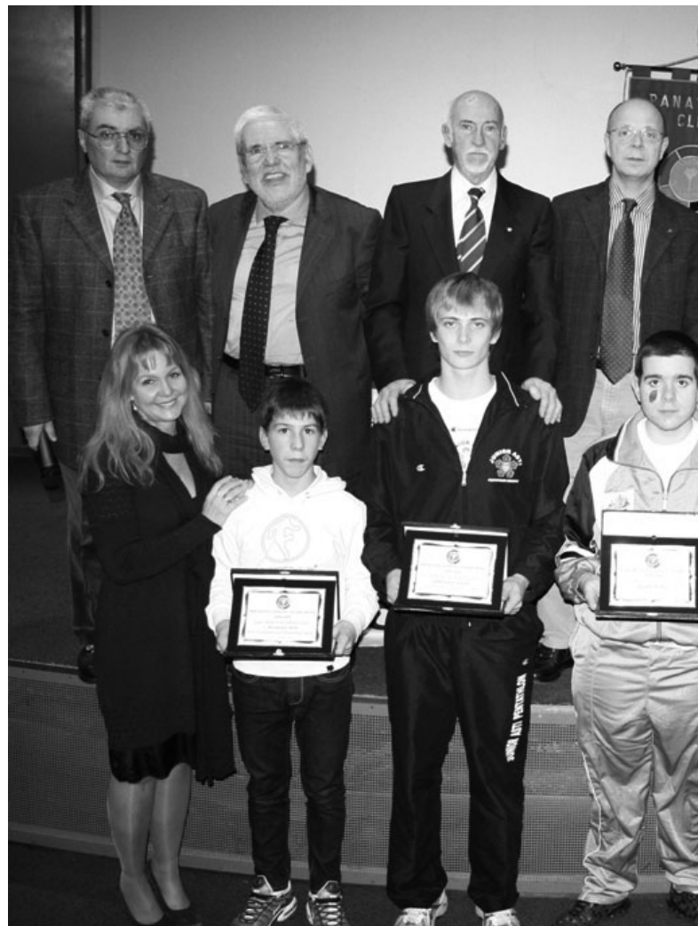
Gli studenti vincitori dei Premi Panathlon Studio & Sport 2008/2009 con le nuoto presidenziale e le premiazioni di "Fair Play" e "Fondazione "Domenico

Sempre nel ricordo del Presidente del Panathlon astigiano del biennio 1996/1997 anche il riconoscimento