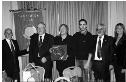
NOVEMBRE "Ventennale GSH Pegaso"